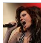
Die Prinzen rocken die Musikmeile