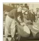
Erinnerung an den schnellen Grafen