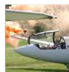
Hochbetrieb im Himmel