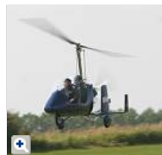
Einst wurde er von James Bond getestet, jetzt war der „Gyrocopter“ auch auf der Wiedenfelder Höhe im Einsatz.

Hochbetrieb herrschte beim Flugplatzfest des LSC Erftland. Segelflieger, Motorsegler, Gleitschirmflieger und Modellflugzeuge kreuzten im Himmel über Bergheim. Der Tragschrauber war ein echter Publikumsmagnet.