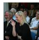
- UPDATE - Frechen wird zum Grafikmekka