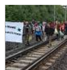
Protest auf den Gleisen