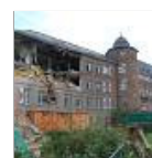
Abriss der Ritterakademie