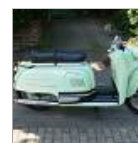
Ein Strolch auf zwei Rädern